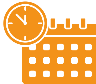
Disponible hasta el 25 de noviembre