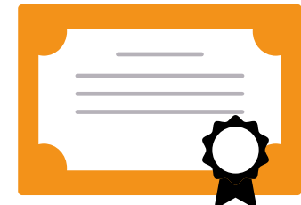
Certificado de formación