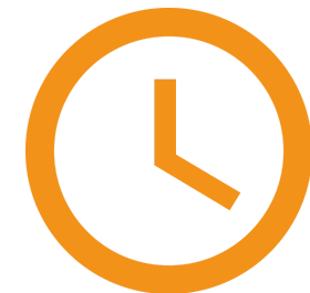
Dedicación recomendada 2 horas/semana